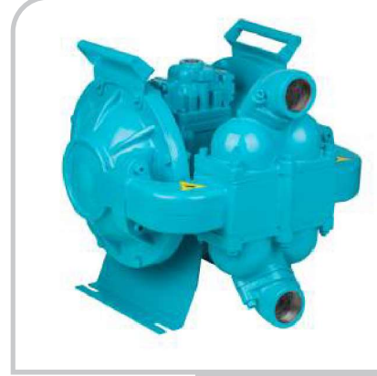
DPH - 20